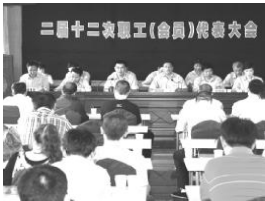
二届十二次职工(会员)代表大会