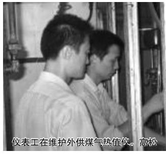
仪表工在维护外供煤气热值仪。高松

在家庭装修工程中,电气线路的安装属于隐蔽工程,一旦留有隐患对日常使用带来不利。所以在开始的设计、施工、安装过程中要一次到位,要做好主要使用,发展使用、大功率使用等方面的预计。在容量分配上以厨房线路尤为重要,有条件的要将厨房线路单独安装敷设,设立独立的配电回路,将厨房中的大功率电器线路分路供电。再就是房间的电路也尽量分出两三个回路,每个回路都配有漏电断路器,安装的插座不宜超过6个,对于空调线路尽可能独立敷设专用线路,照明线路也要多分几路,避免照明出现问题的時候家中一抹黑;至于电视、网络、电话等线路安装要考虑到家中的发