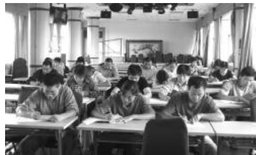
净化车间组织员工进行三季度劳动竞赛技术比武,针对目前车间生产状况,人员紧张,部分岗位合并的具体情况,分工种进行书面考试。图为员工认真答卷。 赵培

总之,只有班组的安全生产管理好了才能实现“三级控制”最基本环节得到实现,才能确保车间、企业的安全生产目标得到实现。 摘自网络